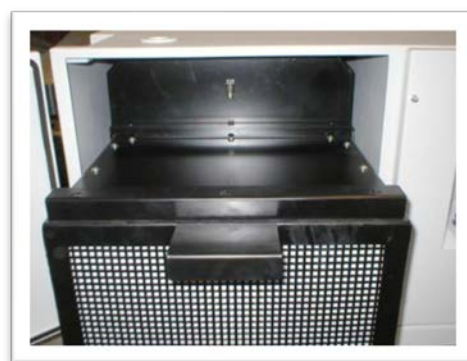
装置内のフィルターボックス