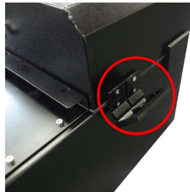
テンションロック