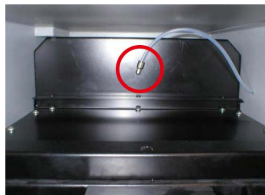
フィルターボックスのエアチューブ