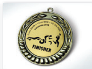
Medalla, personalizada mediante grabado sobre film acrílico de 2 capas