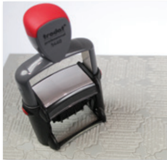
Placa de sello grabada