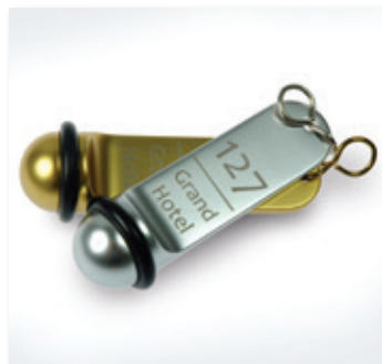
Llaveros grabados de aluminio anodizado