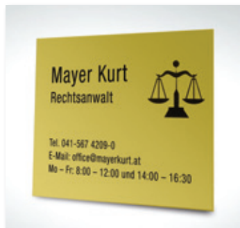
Cartel grabado en negativo

El rayo láser es la herramienta universal para todo. Plásticos, madera, vidrio, MDF, materiales acrílicos, fibras textiles, cartón, papel, láminas, metales... y otros muchos materiales. Olvídense de repuestos de cuchillas o troqueles.