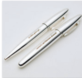
Bolígrafos con personalización elegante