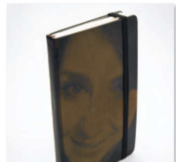
Libreta de cuero con fotografía grabada