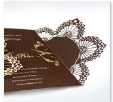
Invitaciones, tarjetas de visita y felicitaciones de papel o cartulina, grabadas y cortadas a láser