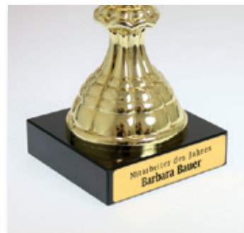
Trofeo con grabado sobre film autoadhesivo de 2 capas