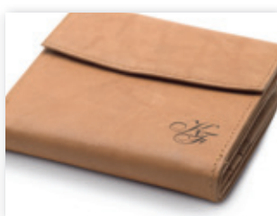
Cartera de piel grabada con láser