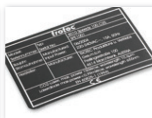
Placa industrial, marcada en aluminio anodizado