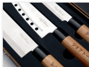
Cuchillos marcados con láser