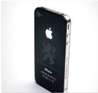
Teléfono móvil grabado en aluminio anodizado

Los sistemas láser de Trotec están diseñados para tener una vida útil larga, incluso realizando un uso intensivo, gracias a su robustez y a la alta calidad de sus componentes. Con un láser de Trotec puede olvidarse de costes adicionales, gastos de mantenimiento, o repuestos.