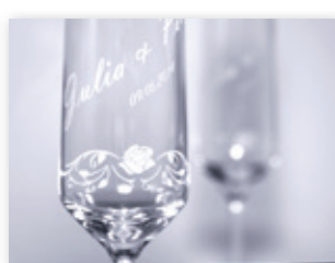
Copas de boda grabadas por láser