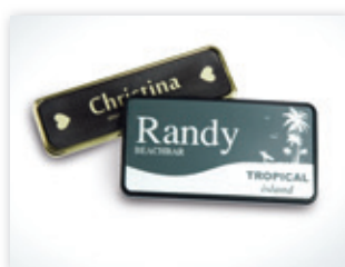
Placa identificativa, grabada en laminado de 2 capas

→ Láseres Trotec – desarrollados y fabricados en Austria.