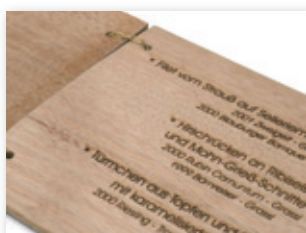
Carta de restaurante grabada en madera