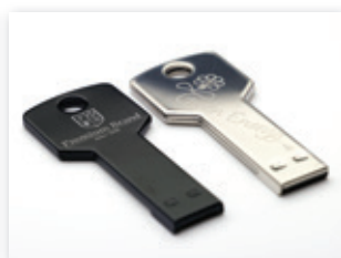
Memorias USB grabadas en aluminio anodizado